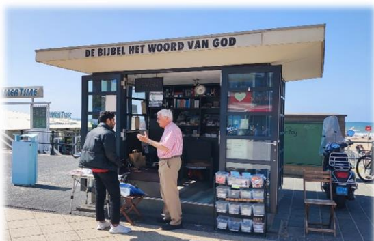
In gesprek met een naar vrede zoekende Moslim

In onze nieuwsbrief nummer 91 van oktober 2022 schreven we over verontrustende berichten uit zowel Afrika als India. Nu we bijna een jaar verder zijn, is dat niet minder verontrustend geworden, integendeel de tijden zijn nog spannender geworden. We merken dat tijdens evangelisatie op de markt bij het station Blaak in Rotterdam op de bolevard in Scheveningen, waar we met een team elke woensdag evangeliseren. Steeds meer mensen voelen aan dat het met de wereld en de aarde op een eind lijkt af te stevenen, zowel wat het klimaat, de economie, de oorlogen, de toenemende immoraliteit en liefdeloosheid als wel de globale onrust die overal te merken is en de publiciteit haalt.