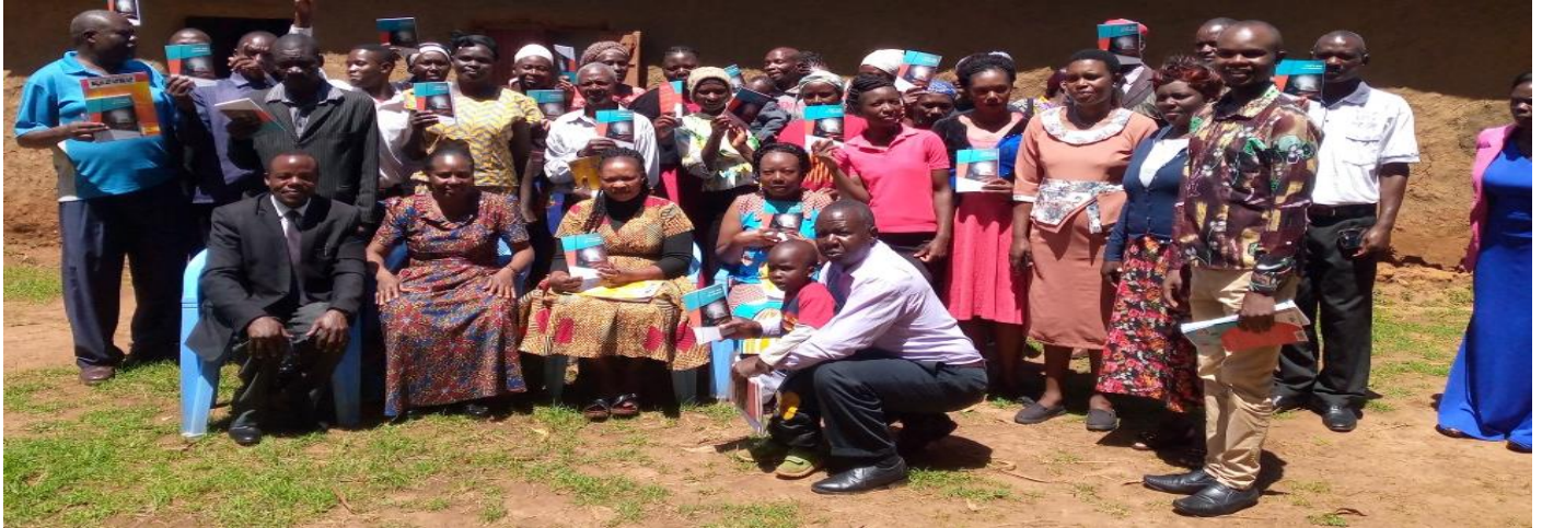
Groepsfoto van Keniaanse Adullam counseling en NET studenten