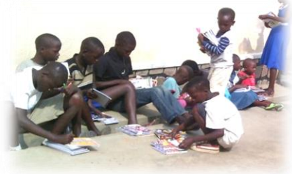
Schoolmaterialen en onderwijs

Tijdens onze counseling seminars ontmoeten we veel weeskinderen op locaties waar we zijn geweest voor counseling. We merken dat we niet al die kinderen kunnen helpen. Maar we doen wat we kunnen. We hebben 11 weeskinderen in ons huis opgenomen, zodat we bij hen kunnen blijven en hen kunnen helpen met voedsel, scholing en onderdak. Helaas, gezien de situatie waarin we als gezin ons in een moeilijke financiële positie bevinden als gevolg van de zorg voor onze baby van 5 maanden met het z.g. "Downsyndroom". We geven elke maand veel geld uit aan zijn behandeling en bijkomende ziekenhuiskosten. Daarom wordt het moeilijk om te voorzien in alle behoeften om de zorg voor de elf weeskinderen in ons huis voort te zetten.